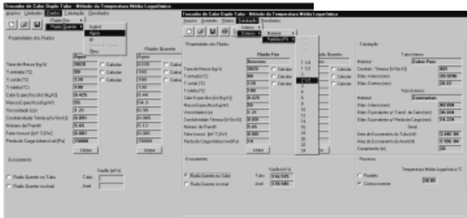
Figura 2 – Tela de entrada de dados para trocador duplo-tubo – opção para escolha do fluido e da especificação das tubulações.

Aparecerá automaticamente o valor da diferença de temperatura média calculado, assim como áreas interna (tubo) e externa (anel).