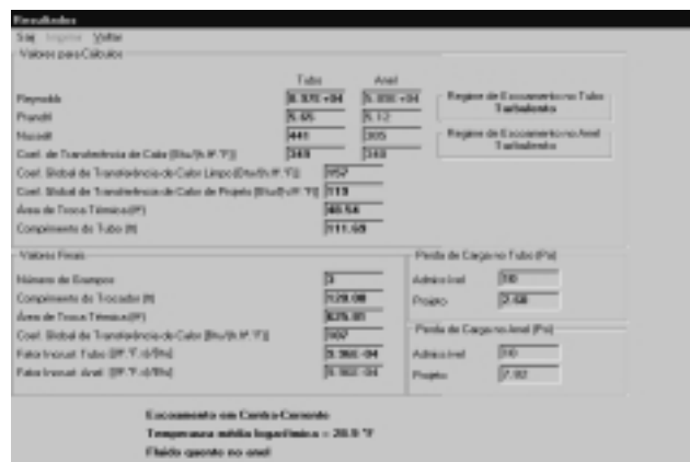
Figura 3 - Tela de resultados para trocador duplo-tubo.

A opção Resultados do menu, realiza o cálculo da troca térmica e da perda de carga e apresenta os principais resultados: números de Reynolds, coeficientes de transferência de calor interno, externo e global, área de troca térmica, comprimento do trocador, número de grampos necessários e perdas de carga interna e externa. Conforme o número de grampos resultante os valores do comprimento, área, coeficiente global e incrustação são recalculados e apresentados como valores finais (Fig. 3). Somente quando os dados estiverem todos validados será possível executar o programa e ainda assim os resultados podem indicar, que embora o cálculo tenha sido realizado o projeto apresenta deficiências.